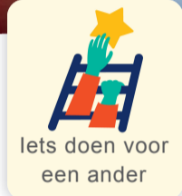
Iets doen voor een ander